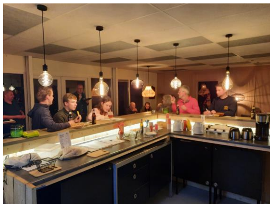
Druk aan het denken en aan het overleggen