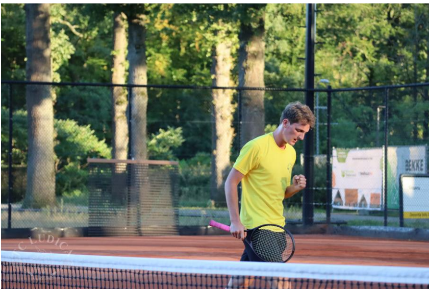
Waalko een 1 e plaats HE5 bij Ludica in Enschede